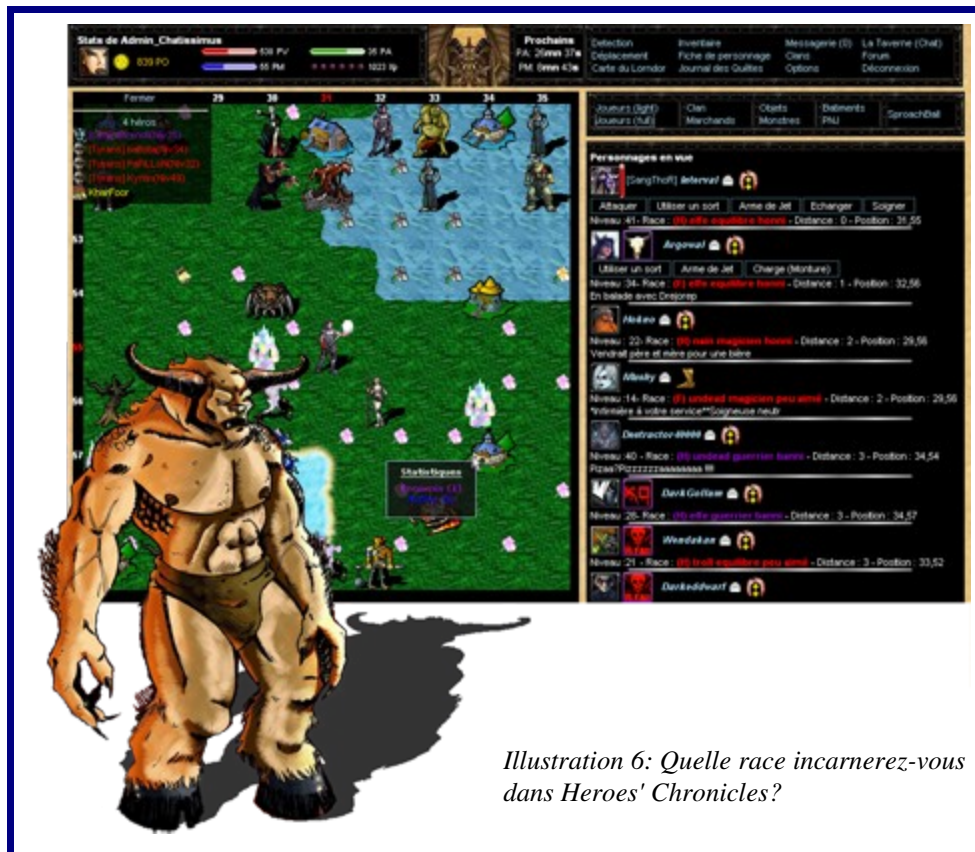
Illustration 6: Quelle race incarnerez-vous dans Heroes' Chronicles?

Chasseur de primes, Soigneur, Soldat, Assassin, Chasseur ou bien encore Alchimiste, chacun peut trouver sa voie sur ces terres de batailles.