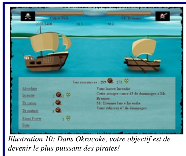
Illustration 10: Dans Okracoke, votre objectif est de devenir le plus puissant des pirates!

Okracoke est un jeu de gestion, avec une pincée d'aventure et un soupçon de RPG. Vous y dirigez un pirate qui débarque avec 2 matelots sur une barque dans une ville qui va devenir son port d'attache. Vous allez devoir vous débrouiller pour recruter des moussaillons, acheter de l'équipement et des ressources pour aller conquérir les eaux du monde d'Okracoke et devenir le plus puissant des pirates.