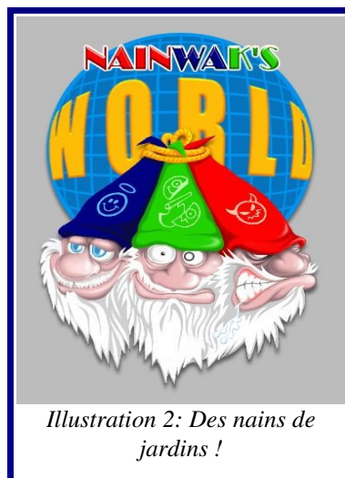
Illustration 2: Des nains de jardins !

Les nains de jardin "glissent" de monde en monde, ramassent et utilisent des objets, attaquent ou discutent avec leurs voisins... Une vie bien remplie !