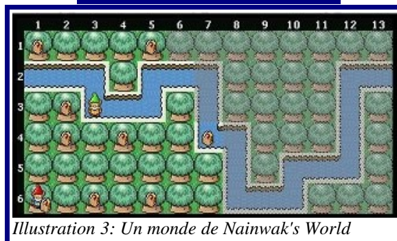
Illustration 3: Un monde de Nainwak's World