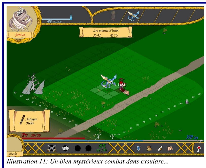
Illustration 11: Un bien mystérieux combat dans exsulare...