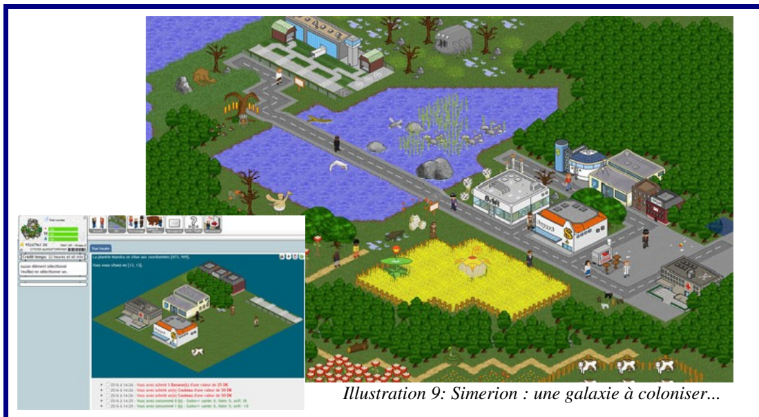
Illustration 9: Simerion : une galaxie à coloniser...

Simerion est un jeu mélangeant RPG et jeu de gestion dans un univers futuriste proche. Chaque joueur endosse le rôle d'un colon issu de la Terre ayant pour mission de peupler les colonies planétaires fraîchement découvertes. Le joueur possède 24 heures de Crédit-Temps par jour qu'il peut utiliser à sa guise. Il est alors libre de se déplacer sur des planètes immenses, de prendre des navettes pour se rendre où il désire. Il peut réaliser des missions parmi tout un panel. Ces dernières étant bien souvent liées, le joueur est guidé tout du long par une trame scénarisée qui le mènera un peu partout dans la galaxie et qui lui fera rencontrer de nombreuses personnes, faire éclater intrigues politiques et complots, mais aussi faire des découvertes scientifiques et philosophiques.