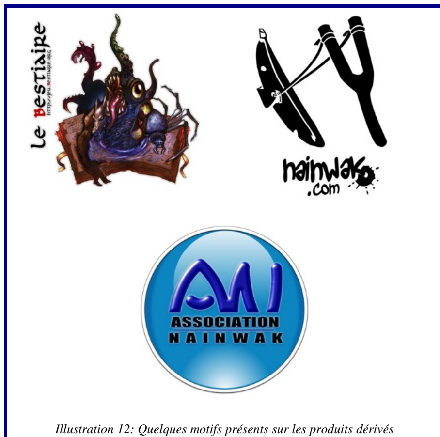
Illustration 12: Quelques motifs présents sur les produits dérivés

L'association est en perpétuelle quête pour pouvoir financer les serveurs et est toujours à la recherche de sponsors et de partenaires.