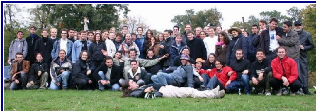
Illustration 1: Photo de la Rencontre à Paris