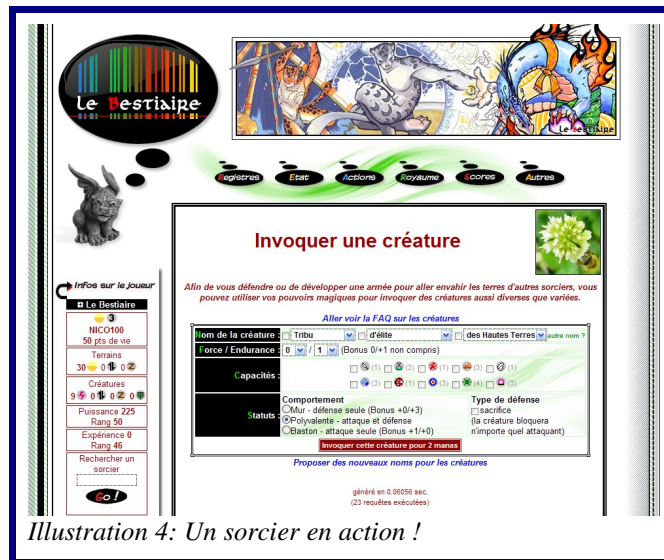
Illustration 4: Un sorcier en action !

Jeu en ligne en PHP, fondé sur l'univers du CCG Magic l'Assemblée©. Vous incarnez un sorcier appartenant à un royaume et luttez pour vaincre les sorciers des autres royaumes, à l'aide des créatures invoquées, de sorts et de puissants rituels.