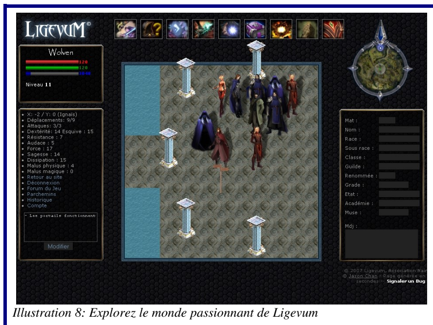
Illustration 8: Explorez le monde passionnant de Ligevum

Ligevum est un jeu de rôle asynchrone, car même s'il est en ligne, il ne se joue pas en temps réel. C'est un jeu par tour.